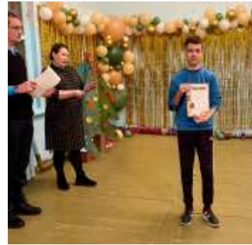
Нязепетровский филиал - подведение итогов Недели английского языка и награждение студентов.