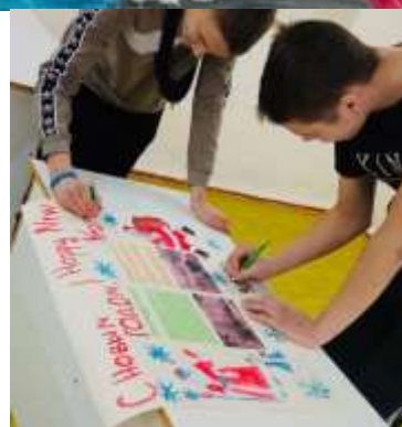
Конкурс плакатов «Рождественский туризм»