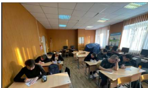
г.Касли - Викторина «Christmas English»